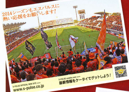
2014シーズンもエスパルスに 熱い応援をお願いします! S-PULSE OFFICIAL WEB SITE WWW.S-PULSE.CO.JP 最新情報をケータイでゲットしよう!